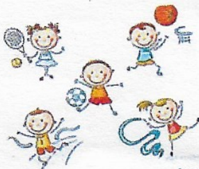
Activités sportives enfants