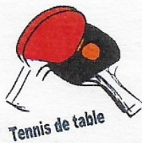
Tennis de table