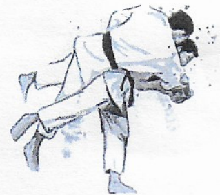
Initiation Judo, Jujitsu, Taïso