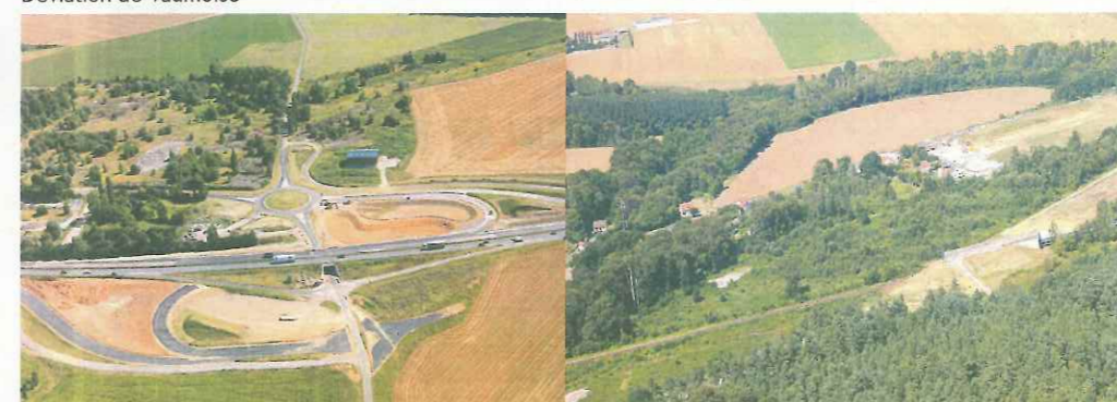
Déviations de Vaumoise

Après la réalisation d'un ouvrage d'art à Coyolles et la requalification de l'échangeur de la sucrerie, les travaux de terrassement ont débuté et devraient se terminer d'ici à la fin 2017. Resterait alors la réalisation de la chaussée et un passage grande faune à hauteur de La Chabanne.